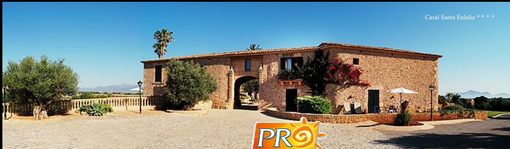
Casal Santa Eulalia * * * *